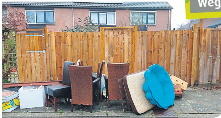
Geen grofvuil, maar grof afval dat prima gescheiden en gerecycled kan worden!